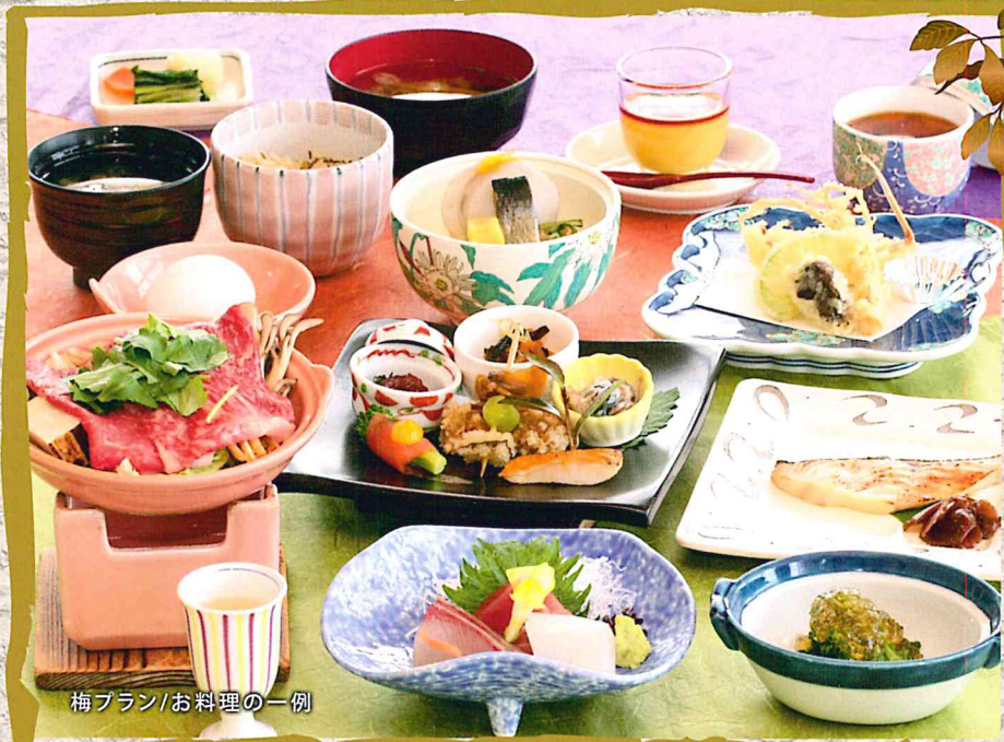
梅プラン/お料理の一例